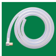
① 娩出・外科用 (コネクター付)