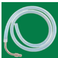
② アウス用 (コネクター付)