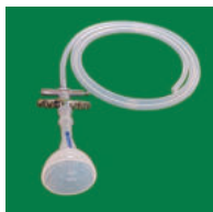
② ソフトバキュームカップ S,M,L