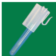
④ カテーテルホルダー (2個付)