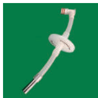
④ PTFEフィルターユニット