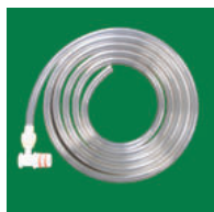
③ 羊水吸引用 (コネクター付)