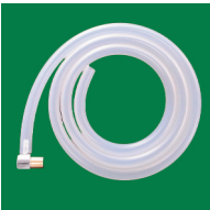
① 娩出・外科用 （コネクター付）