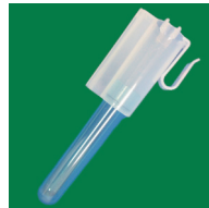
④ カテーテルホルダー （2個付）