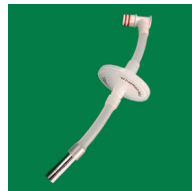
④ PTFEフィルターユニット