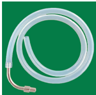
② アウス用 （コネクター付）