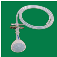
② ソフトバキュームカップ S,M,L