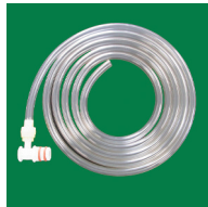
③ 羊水吸引用 （コネクター付）